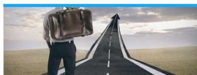
Repozytorium z doradztwa zawodowego