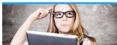
Materiały dla uczniów