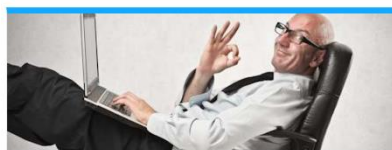
Materiały dla nauczycieli