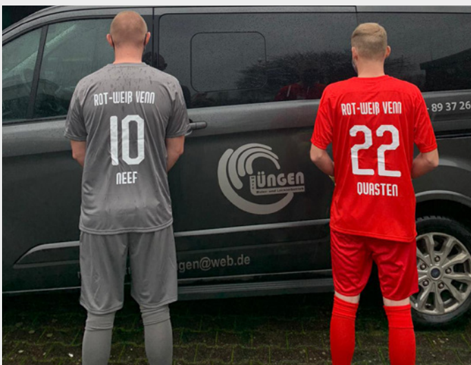
Wie die Profis: personalisierte Trikots