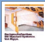
Dachgeschossaufbau Mit Standard-Systemen Von Rigips.

Windmühlenweg 43 41068 Mönchengladbach Telefon: 021 61/575 4795 Fax: 021 61/575 47 13 Mobil: 01 73/541 9028 E-Mail: Ralf.Piesczek@t-online.de